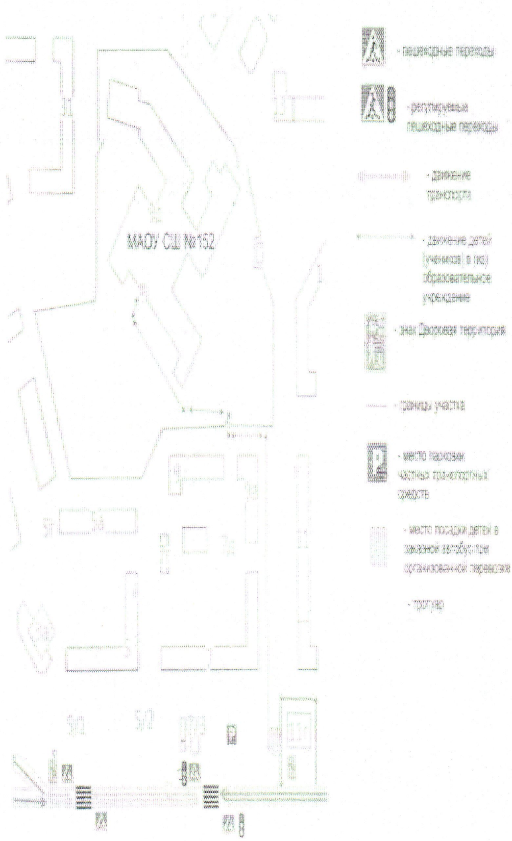
Схема движения детей МАОУ СШ №152 к месту посадки в заказной автобус при организованной перевозке групп детей